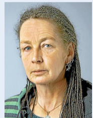
Von Martina Koelschitzky

„Meelstaa“ kommt wieder ins Hinterland, am Mittwoch, 23. August, sind sie im Biedenkopfer Schloss zu hören. Darauf freue ich mich schon jetzt. Weil diese Band für mich etwas ganz besonderes ist. Sie zeigen einen Weg für die Zukunft regionaler Kultur: Sie verbinden heimische Traditionen und Sprache mit einer Musik, die einmal genau für das Gegenteil stand, als wir jung waren. Folk, Rock und Blues haben wir als junge Leute oft gegen den Willen unserer Eltern gehört, weil wir einen weiteren Horizont wollten, mehr als was unsere Heimatdörfer uns geboten haben. Die vier Männer von „Meelstaa“ holen unsere Träume von einem abenteuerlichen Leben in die Heimat zurück. Sie zeigen, dass im Platt Poesie und gute Musik ihren Platz haben, dass wir nicht weggehen müssen, um unsere Träume zu leben. Und ihre Musik ist eine Zukunftsvision: Die Verbindung von regionaler Kultur und Welttoffenheit zu einer neuen Kunstform. Es wird bestimmt wieder ein super-schönes Konzert.