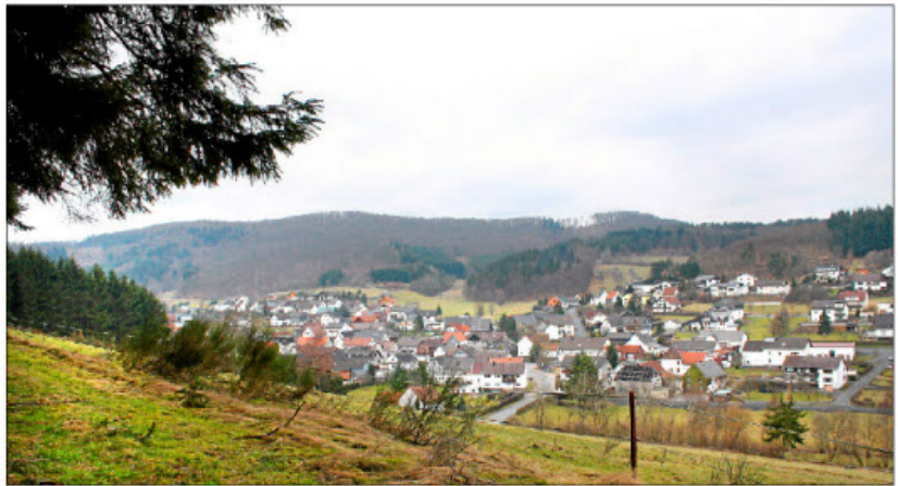
Mehr als die Hälfte der 753 Einwohner von Wiesench sprechen noch Platt - aber fast nur die über 40-Jährigen. (Fotos: Koelschitzky)

„Das kam von der Schule“, erinnert sich Wagner. „Dort hieß es immer, wie benachteiligt Menschen wären, die Platt sprächen. Heute weiß man zwar, dass es genau umgekehrt ist, das mit Platt aufgewachsene Kinder zum Beispiel viel besser schreiben können, aber damals glaubten die Eltern, sie tun ihren Kindern etwas Gutes, wenn sie sie hochdeutsch erziehen“, sagt der engagierte Dialekt-Aktivist.