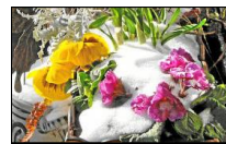
Frihjoahr 2013

Seit 2005 erscheint die Zeitung des Vereins „Dialekt im Hinterland“ als Sonderdruck des Hinterländer Anzeigers.