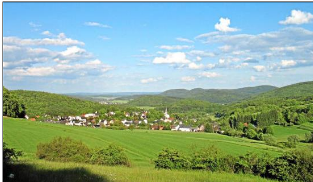
Blick über Wommelshausen aus Nordwest ins untere Salzbödel

Bai dem Wa'd Heemet komme Erinnerung oh viel Schnäi em Wenfer, eiskalke Fongern en Därf ze hern woar en wann da baal denoch die Dreschmaschienen surre däd. Zeom Beld vo de Heemet geherd äch der en de Herbstsonn nochmls en saiger ganze Procht flammebont offlächende Waald.