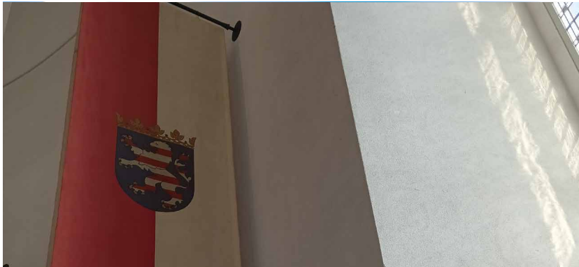
Hessenflagge in der Frankfurter Paulskirche

Der Verein schrieb also an alle Fraktionen im Hessischen Landtag und vertrat seinen Standpunkt, dass Sprache zu den ganz elementaren Bausteinen einer jeden Kultur gehört und die Vielfalt an regionalen Sprachen ein jahrhundertaltes prägendes Merkmal unseres Landes sei. Da bislang der Erhalt