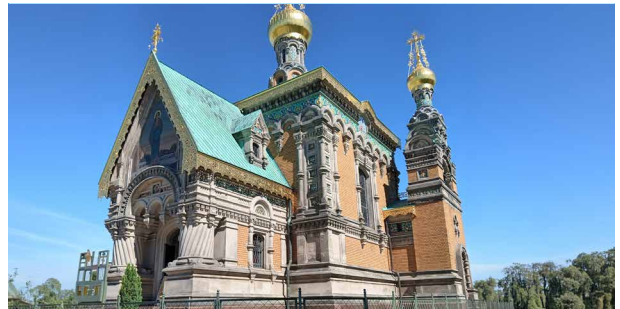
Russische Kapelle auf der Mathildenhöhe

Im Rahmen einer Führung werden wir viel über das Weltkulturerbe Mathildenhöhe erfahren. Mit dem markanten Ausstellungsgebäude samt Hochzeitsturm (beide 1908), dem Museum Künstlerkolonie (1901) sowie der Städtischen Kunstsammlung Darmstadt, bildet es einen außergewöhnlichen Ort der Erforschung, Präsentation und Vermittlung von Kunst und Kultur seit 1900. Das Museum Künstlerkolonie befindet sich im historischen, von Joseph Maria Olbrich 1901 vollendeten Ernst Ludwig-Haus und macht das umfassende kreative Schaffen der vielen Universalisten, die von 1899 bis 1914 auf der Mathildenhöhe gearbeitet haben, erlebbar. Seit 2021 zählt die Mathildenhöhe zum Unesco-Weltkulturerbe.